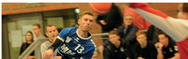
TuS Eintracht Oberlütbe e.V.

Anregungen und Verbesserungsvorschläge könnt ihr gerne per Mail an oe@zusetzen.de richten.